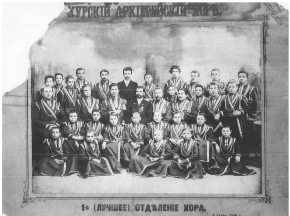
Фотография архиерейского хора (08.03.1900)