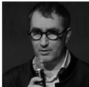
Г. А. Заславский, профессор, ректор Российского института театрального искусства – ГИТИС